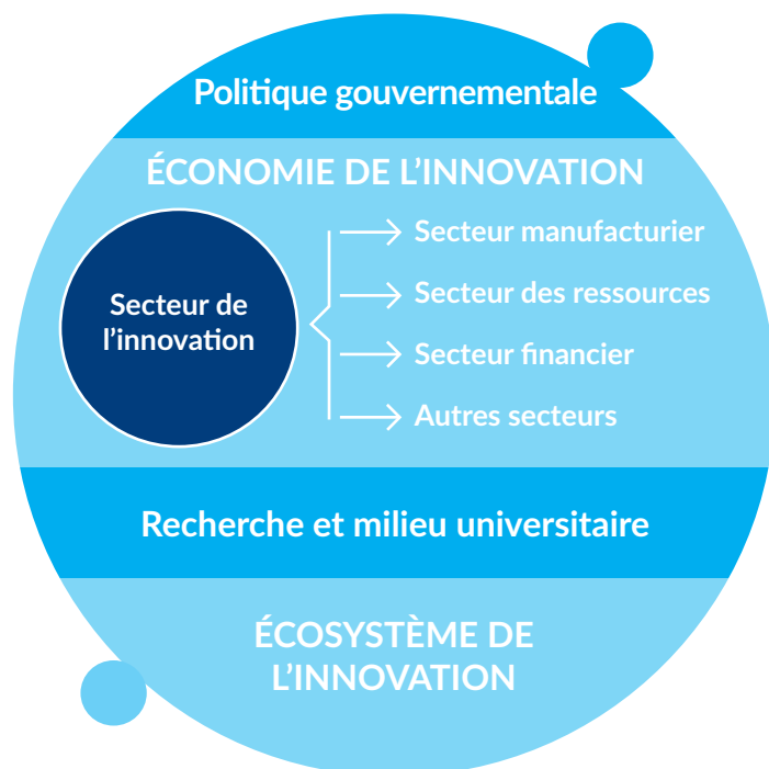
Figure 1 : Relations entre le secteur de l'innovation, l'économie de l'innovation et l'écosystème de l'innovation

Le secteur de l'innovation, l'économie de l'innovation et l'écosystème d'innovation peuvent être considérés comme des cercles concentriques. Le secteur de l'innovation comprend les activités économiques des sociétés axées sur la technologie. L'économie de l'innovation englobe le secteur de l'innovation et les retombées de ses activités sur la productivité des autres secteurs qui adoptent les technologies. L'écosystème de l'innovation étend le périmètre de l'économie de l'innovation pour intégrer les fondements sur lesquels reposent la viabilité et la croissance du système, y compris l'infrastructure requise : politiques publiques, établissements de recherche, universités et établissements d'enseignement.